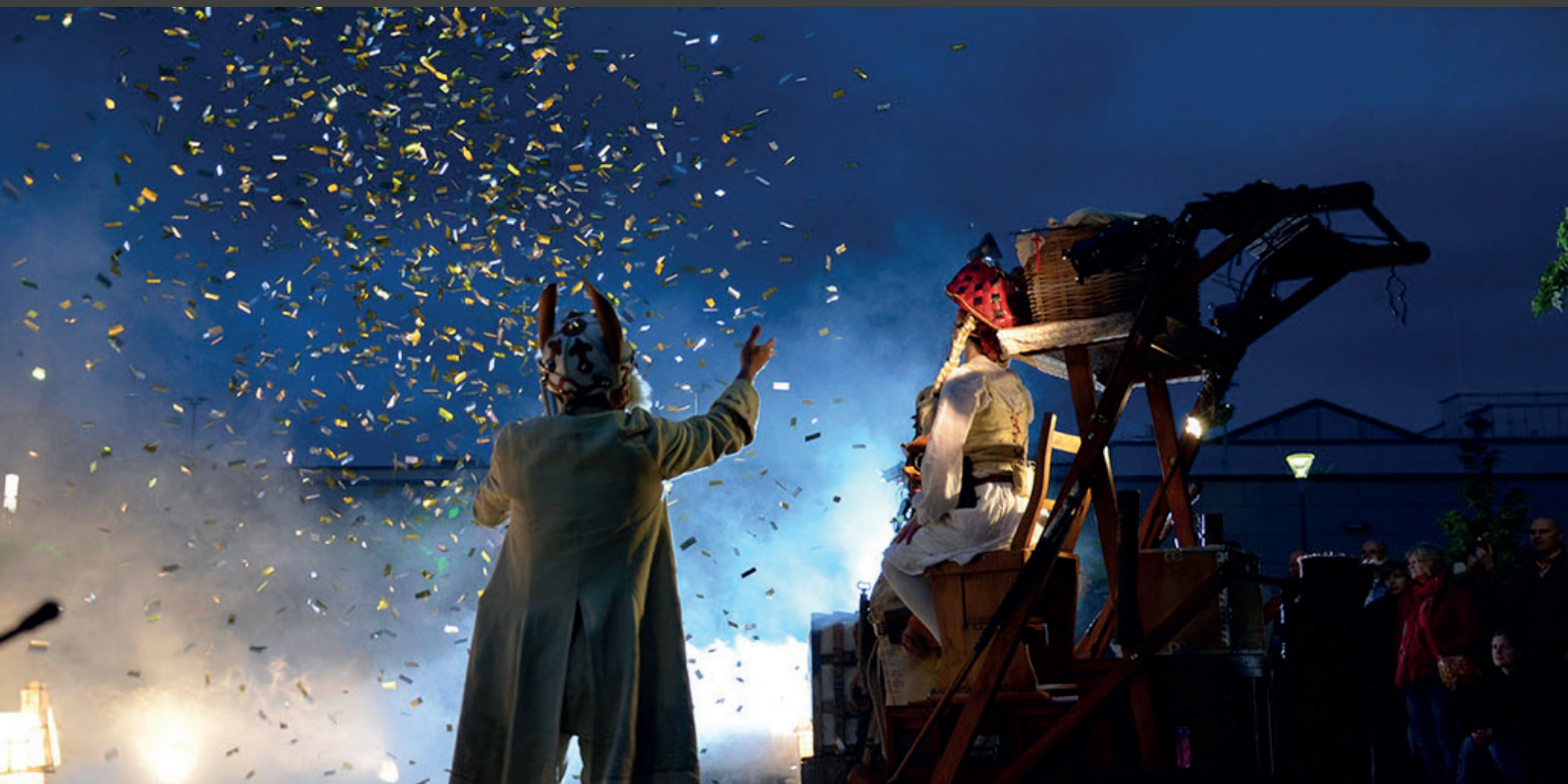
ALICE AU PAYS DES MERVEILLES ( © LES ANTHROPOLOGUES 2015 )