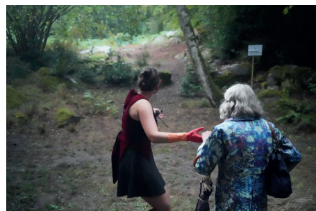
LES OUVREUSES EN INTERACTION AVEC LES SPECTATEURS